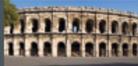
ARÈNES DE NÎMES Nîmes