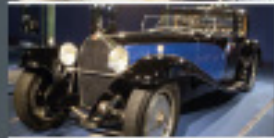
CITÉ DE L'AUTOMOBILE Mulhouse