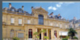
MUSÉE JACQUEMART-ANDRÉ Paris