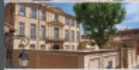
HÔTEL DE CAUMONT CENTRE D'ART Abt-en-Provence