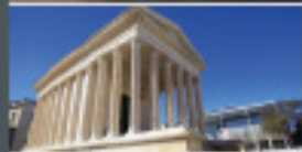
MAISON CARRÉE, TOUR MAGNE Nîmes