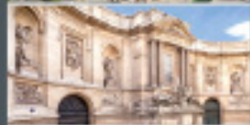
MUSÉE MAILLOL Paris