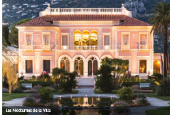
Les Nocturnes de la Villa