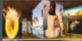
CARRIÈRES DE LUMIÈRES Les Baux-de-Provence