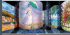
ATELIER DES LUMIÈRES Paris