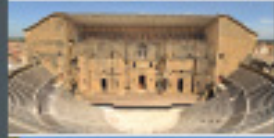
THÉÂTRE ANTIQUE D'ORANGE & MUSÉE D'ART ET D'HISTOIRE Orange