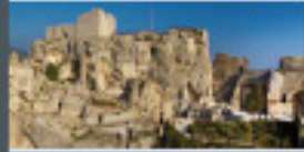
CHÂTEAU DES BAUX-DE-PROVENCE Les Baux-de-Provence